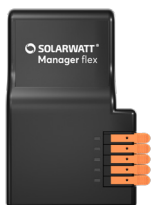
Manager flex 1.5